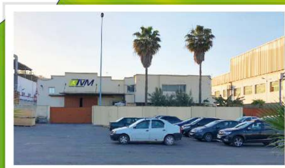
Le bâtiment TVM à Had Soualem