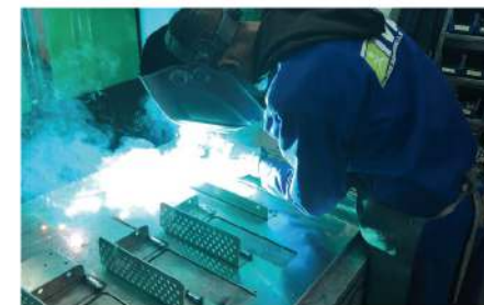
La section soudage

VPN de type B to B: ERP, SMQ, Clients et Fournisseurs.