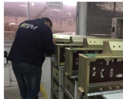
La section aéronautique