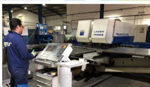
La section découpe

ZI Lot 91 26400 Had Soualem MAROC +212 (0)522 964 594 info@tfc-stpg.fr www.tfc-stpg.fr