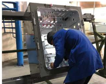
La section peinture